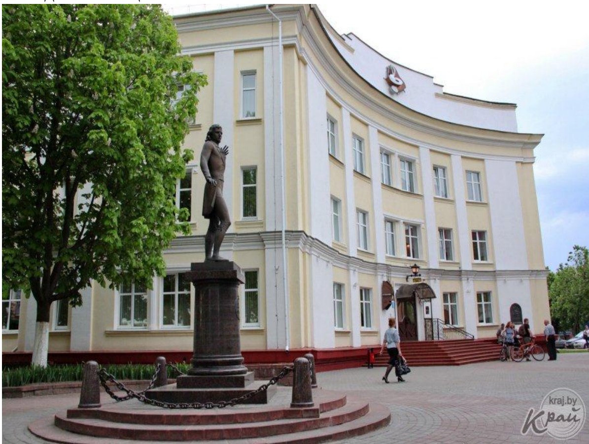
6. Музычны каледж імя М.К.Агінскага