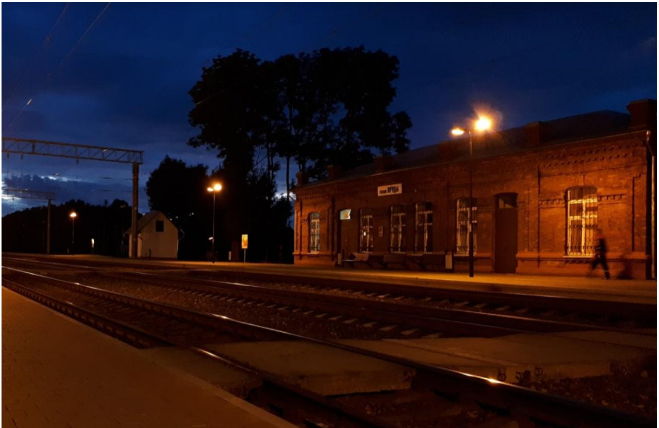
7. Ст. Пруды