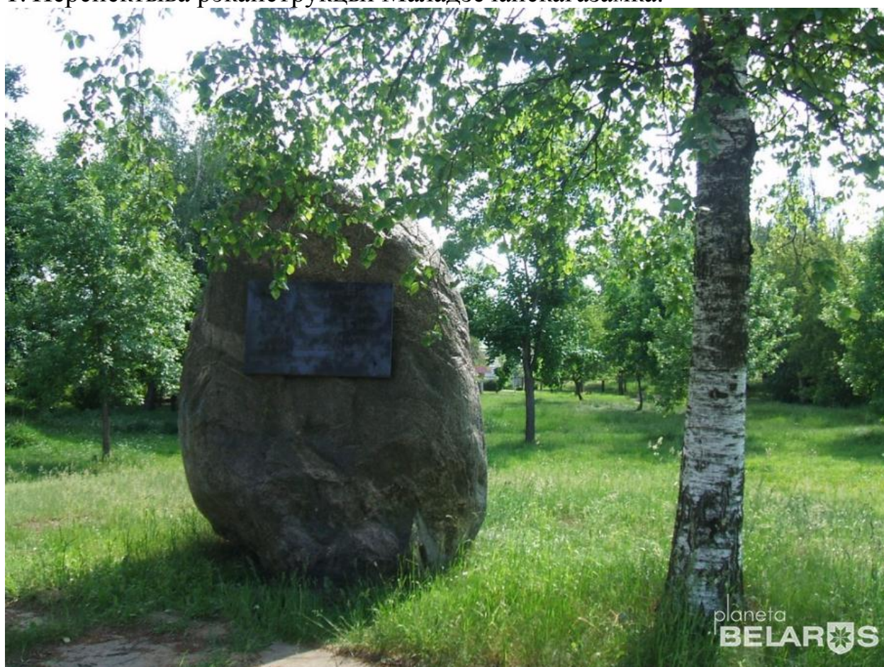
2. Камень-валун, які нагадвае аб вайне 1812 г.