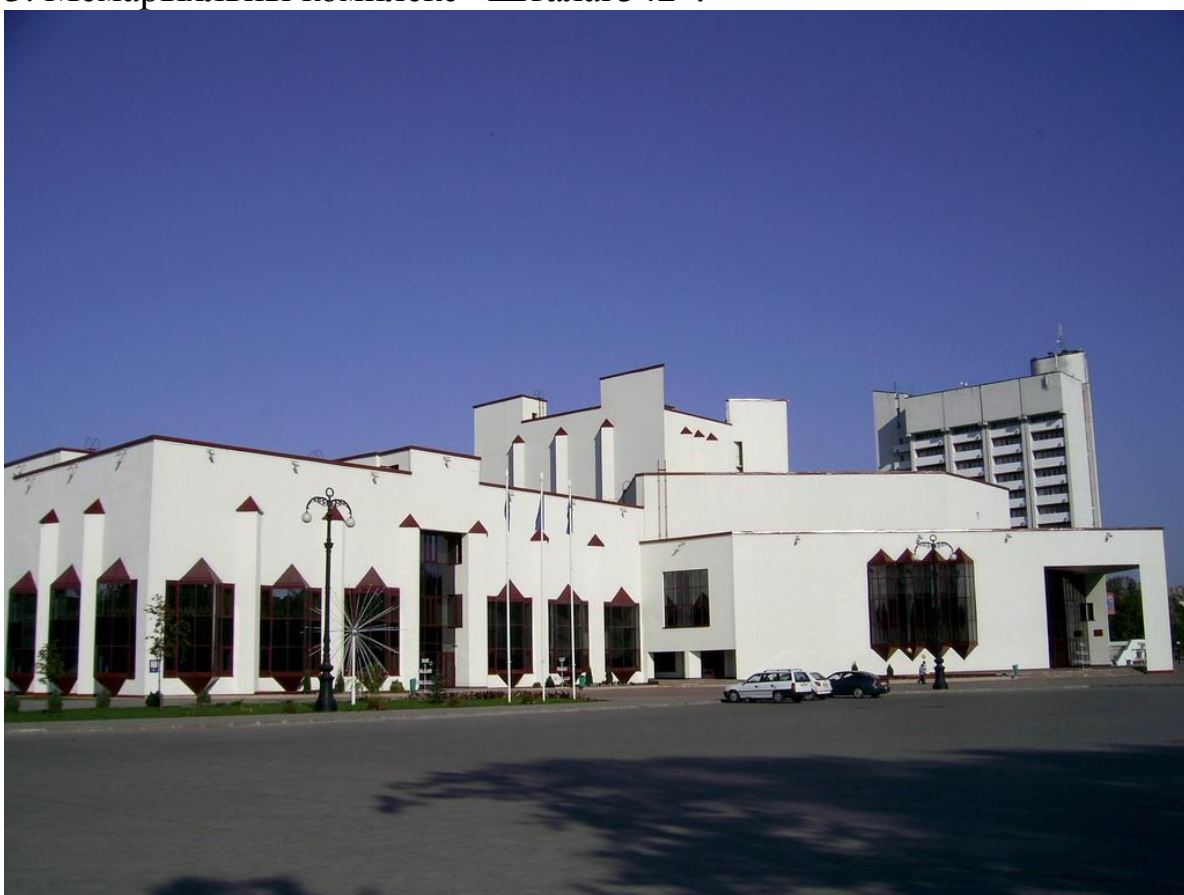
4. Палац культуры.