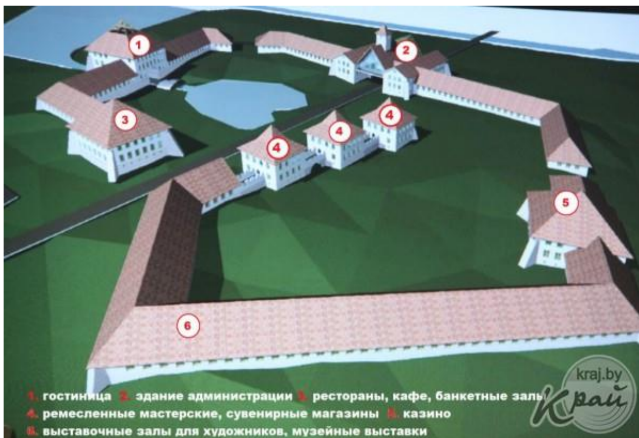
1. Перспектива рэканструкцыі Маладзечанскага замка.