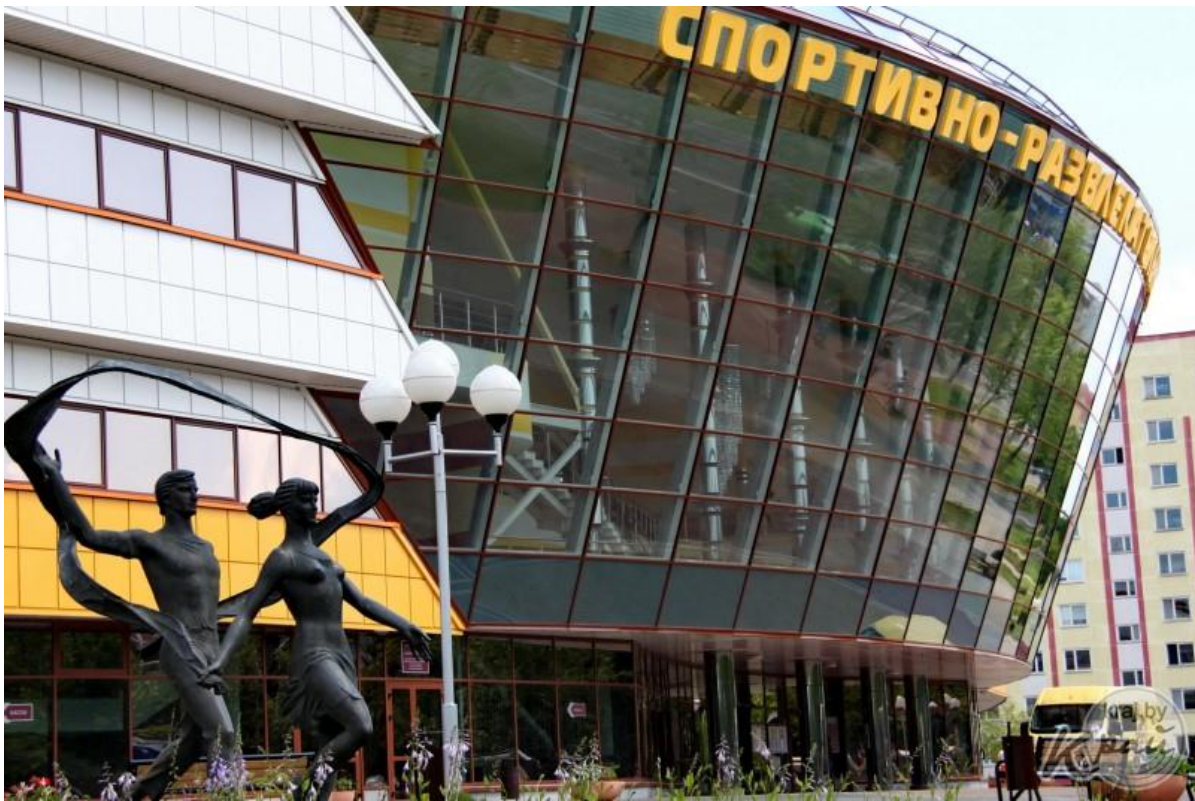
5. Лядовы палац “Алімпік-2011”