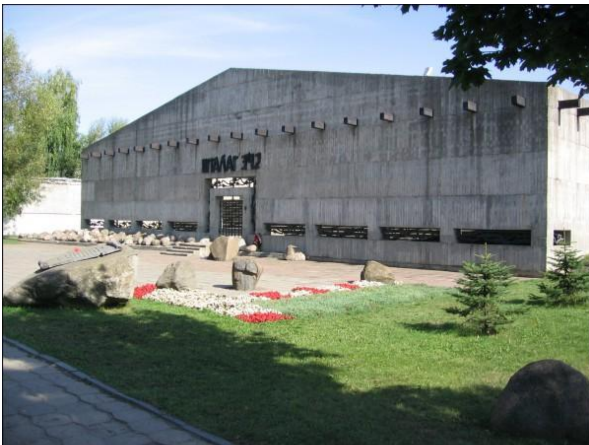
3. Мемарыяльны комплекс “Шталаг342”.