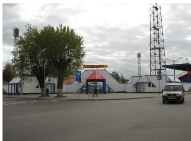
Фота 8. Пляц