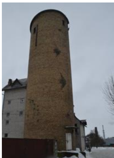
Фота 2. Воданепорная вежа