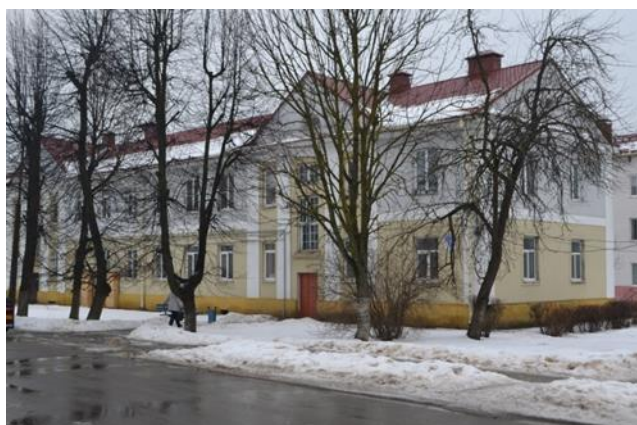
Фота 4. Жылы дом для сем'яў сяржантаў і падафіцэраў