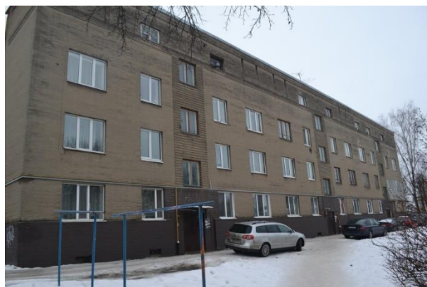
Фота 6. Жылы дом для сем'яў афіцэраў