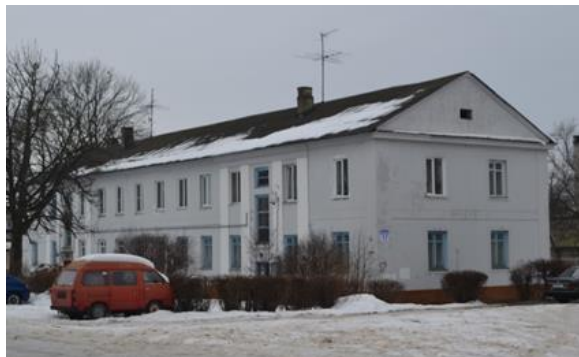
Фота 3. Жылы дом для сем'яў сяржантаў і падафіцэраў