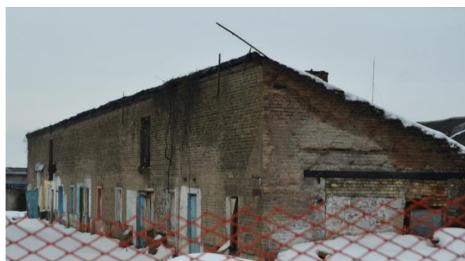
Фота 12. Стайні