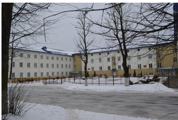
Фота 1. Казармы для салдат