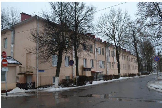
Фота 9. Штаб 86-га палка