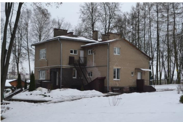
Фота 10. Дом каменданта гарнізона