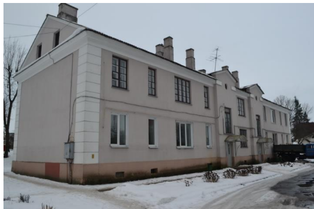
Фота 11. Жылы дом для сем'яў сяржантаў і падафіцэраў