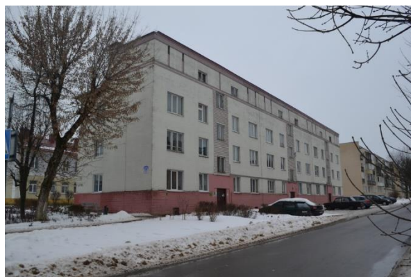
Фота 5. Жылы дом для сем'яў афіцэраў