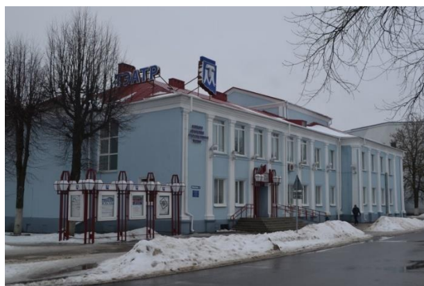
Фота 7. Афіцэрскі клуб